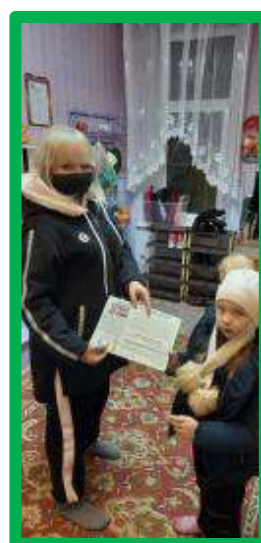
Распространение памяток, буклетов