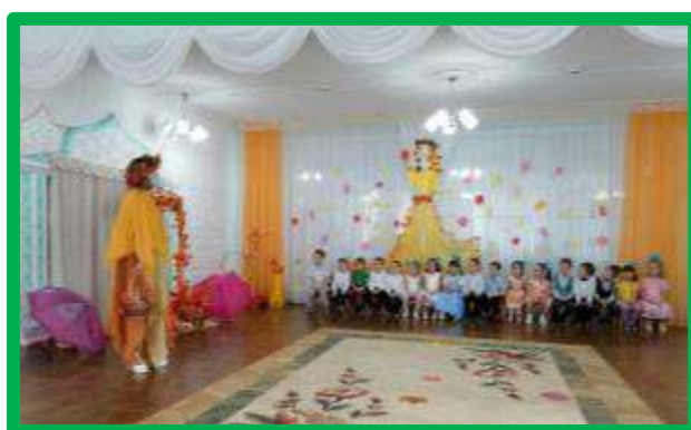
Интерактивная викторина «Мы казачата» (27.11.2020г.)