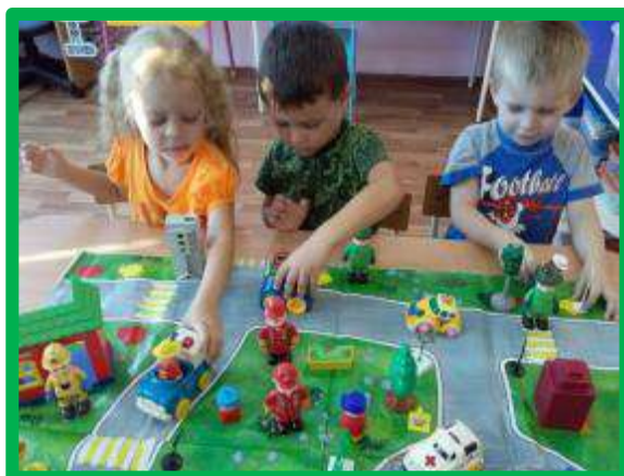
Настольные, дидактические игры

Участие педагогов, родителей (законных представителей) воспитанников, детей во Всероссийской акции «Безопасность детства – 2020», инициированной Уполномоченным при Президенте Российской Федерации по правам ребенка А.Ю. Кузнецовой, направленной на профилактику чрезвычайных происшествий с несовершеннолетними в период с 1 ноября 2020 года по 1 марта 2021 года проведение Дня безопасности 10 числа каждого месяца