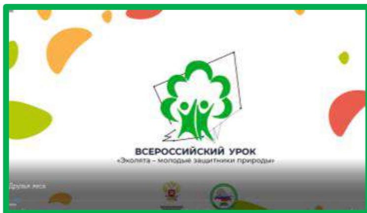
просмотр видео-урока «Друзья леса»

Участие педагогов, родителей (законных представителей) воспитанников, детей во Всероссийской акции «Безопасность детства – 2020», инициированной Уполномоченным при Президенте Российской Федерации по правам ребенка А.Ю. Кузнецовой, направленной на профилактику чрезвычайных происшествий с несовершеннолетними в период с 1 ноября 2020 года по 1 марта 2021 года проведение Дня безопасности 10 числа каждого месяца