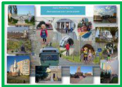
Выпуск газеты «Волгодонск нам всем с детства родной»