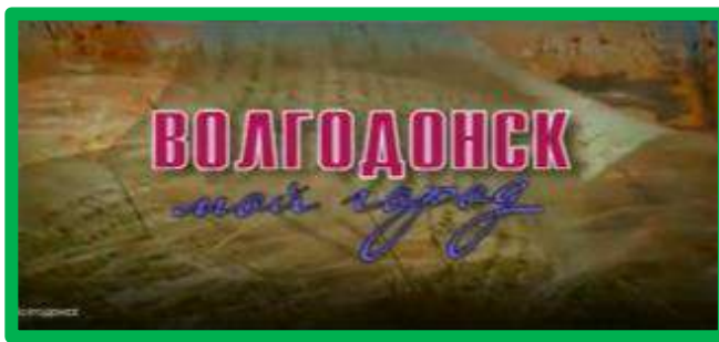
Размещение фильма о городе Волгодонске в родительских группах в сети Интернет через мессенджер WhatsApp