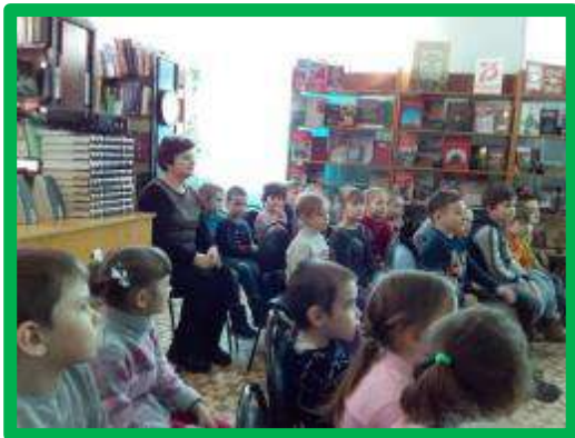
Обучающие уроки о правилах дорожного движения