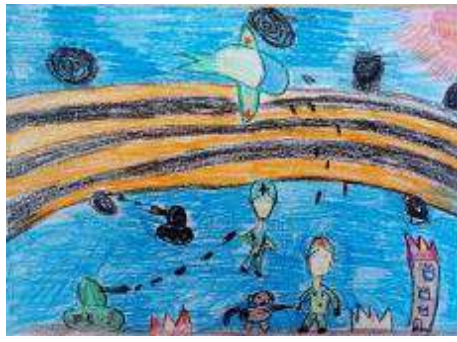
Кулибаба Дарья, 6 лет