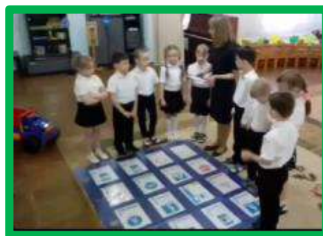
Квест-игра «В поисках волшебного ключа» по ПДД

На основании Указа Президента Российской Федерации от 25 марта 2020 года №206 «Об объявлении в Российской Федерации нерабочих дней», Перечня Поручений по итогам заседания оперативного штаба о координации деятельности по предупреждению завоза и распространения новой коронавирусной инфекции на территории Ростовской области и обеспечения санитарно-эпидемиологического благополучия населения на территории Ростовской области от 26.03.2020 №224 «О мерах по реализации Указа Президента Российской Федерации от 25.03.2020г. №206»