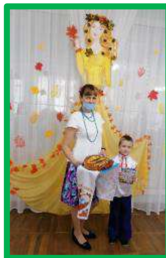
Воспитанники старшего дошкольного возраста МБДОУ ДС «Кораблик» г.Волгодонска приняли активное участие в Всероссийском Уроке «Эколята-молодые защитники природы» (19.11.2020г.)