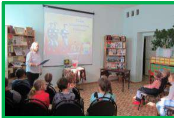
Беседы о защитниках Отечества, о российской Армии